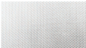
Microprismatique, feuille de diffusion