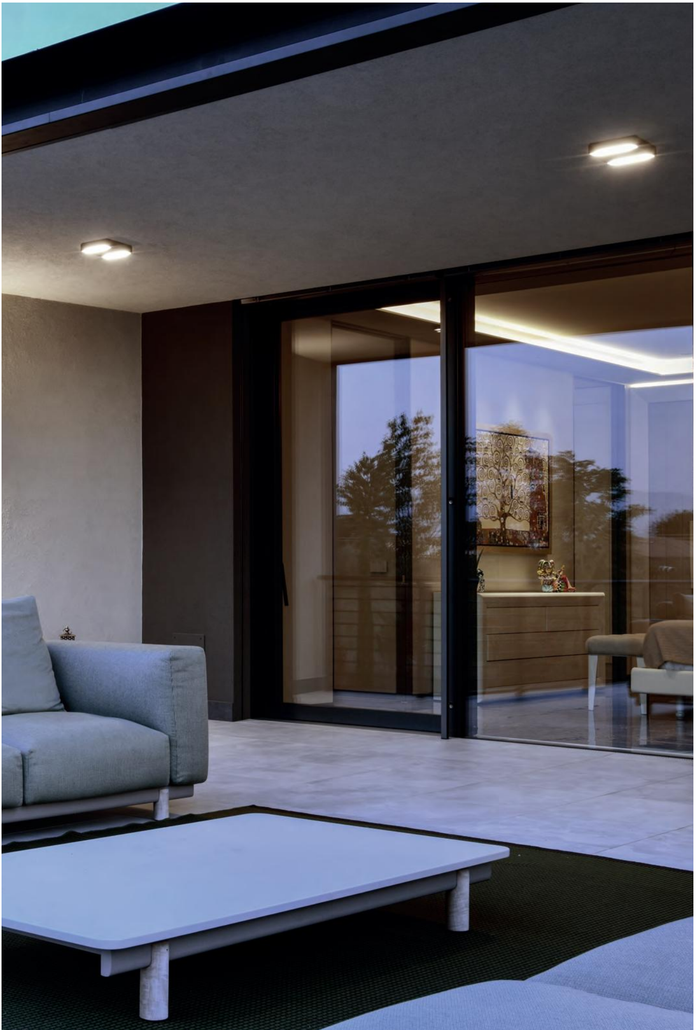
Private Villa - Verona - Italy