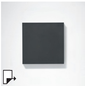
pg 256 MIMIK 20