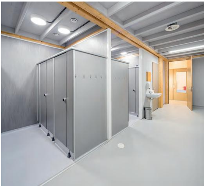
Primary school Het Epos - Rotterdam - Netherlands