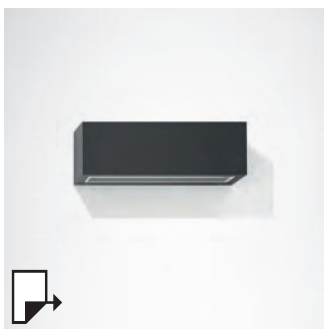
pg 270 QUASAR 30