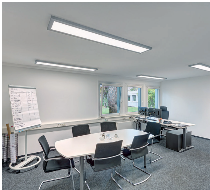
Flughafen Office - Hannover - Germany