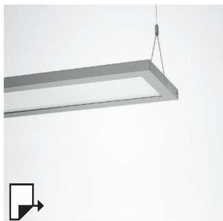
pg 94 SL629 PL