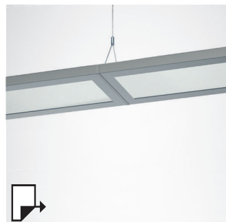
pg 96 SL629 PL CM