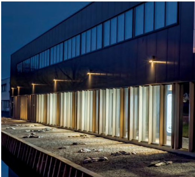
Commercial Building Warmteservice - Gouda - Netherlands